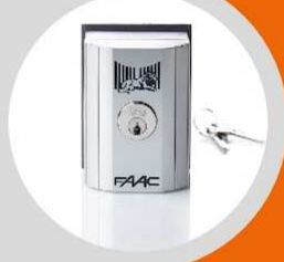
Contacteur à clé