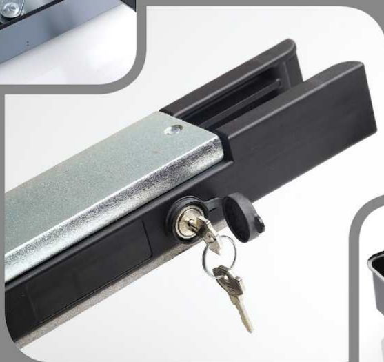
Déverrouillage par clé facile d'utilisation