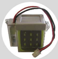
Batterie de secours