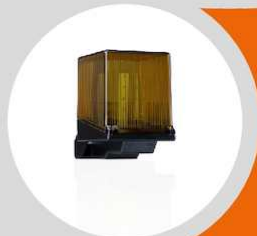
Clignotant led 24V ou 230V